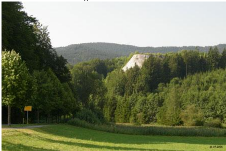
Bergehalde an der Ortseinfahrt zu Marienstein.