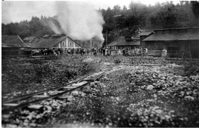
Das Brennende Fördermaschinenhaus 1931