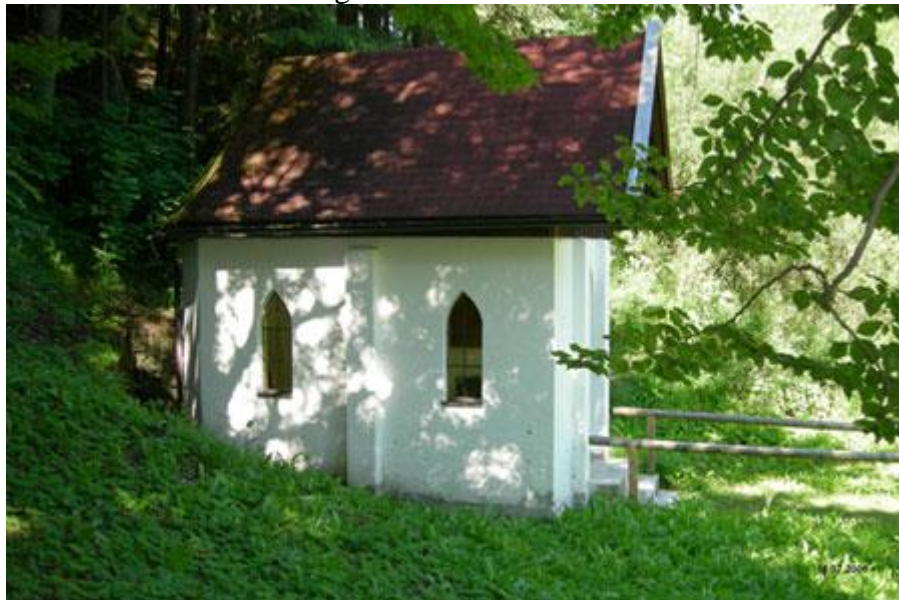
Die Kapelle am alten Fußweg „Bergwerk-Zementfabrik“.