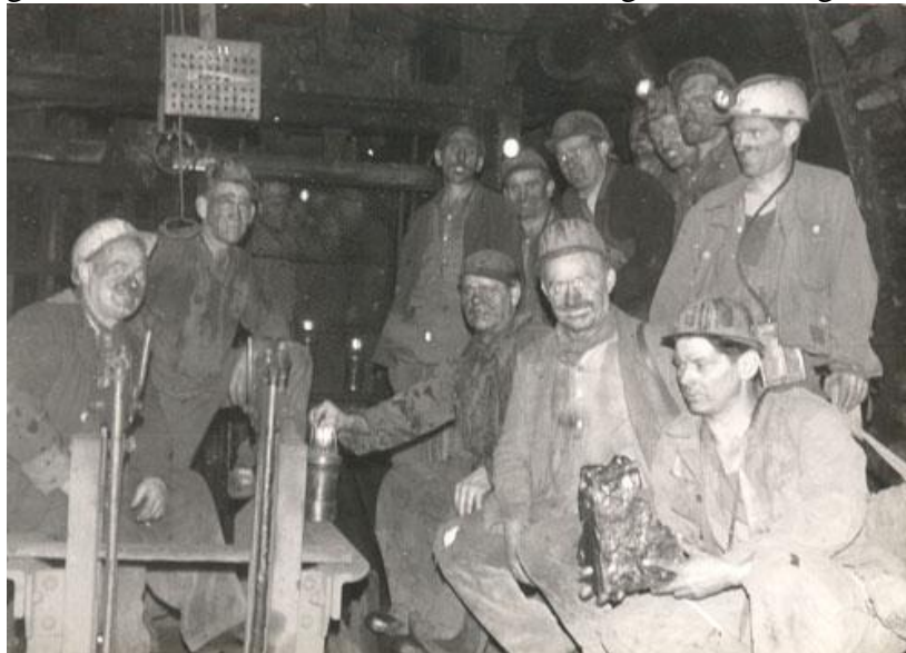
Die Mannschaft fördert ein letztes Stück Kohle zutage.