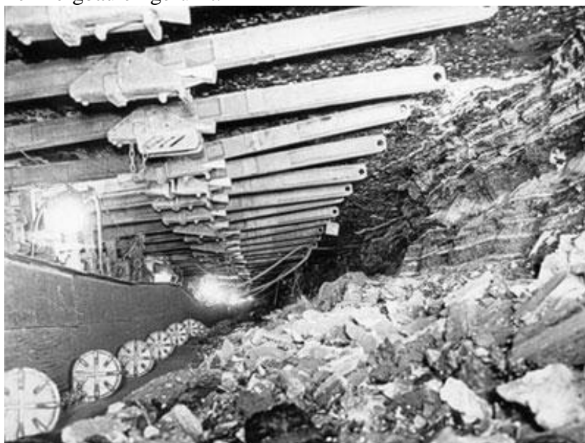
Stauscheibenförderer (Bild aus dem Peissenberger Bergbau)