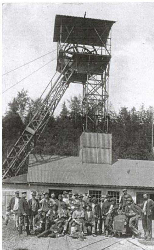
Mannschaft vor dem Fördergerüst

Abteufen des Förderschachtes auf 300 m Tiefe.