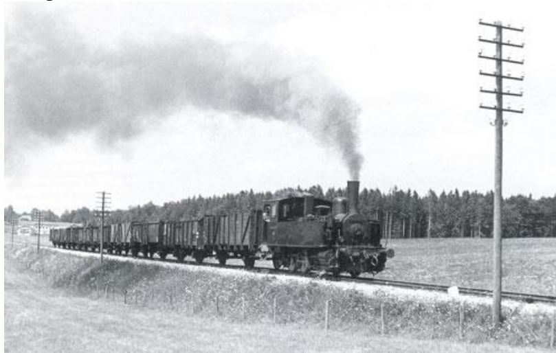
Die Dampflokomotive Marienstein II 1958.