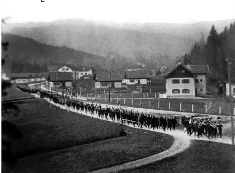
Trauermarsch für die verunglückten Bergleute, 1928.

1928 kommt es zu einem Grubenunglück. Bei einem Förderseilriss sterben sieben Bergmänner.