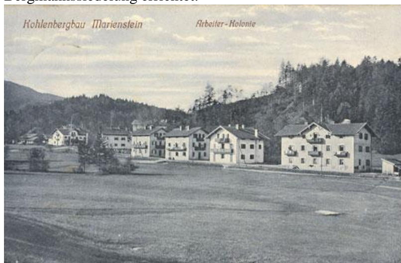
Die ehemalige Arbeiterkolonie

im vorderen Ortsteil, beiderseits des Festenbaches, wird die erste Bergmannssiedlung errichtet.